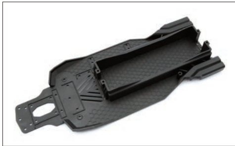
OTA-R31ML メインシャーシ ML JAN : 4562226713646 型番 : R31031 希望小売価格 : 2,000 円(税別)