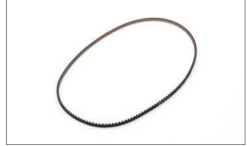
OTA-R31ML センターベルト M 447 JAN : 4562226713622 型番 : R31029 希望小売価格 : 800 円(税別)