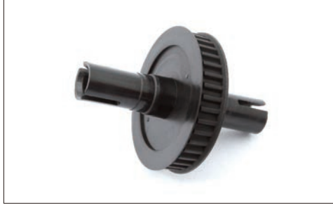
OTA-R31 ソリッドアクスル R JAN : 4562226713615 型番 : R31028 希望小売価格 : 500 円(税別)