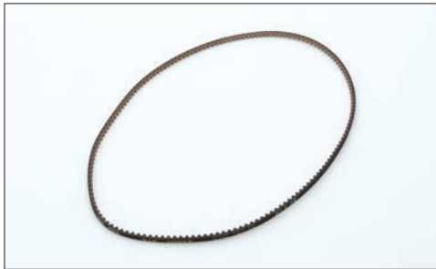
OTA-R31ML センターベルト L 480 JAN : 4562226713639 型番 : R31030 希望小売価格 : 800 円(税別)