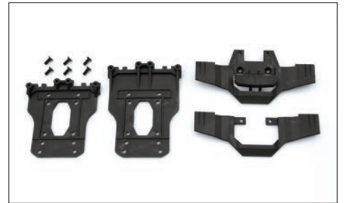
OTA-R31ML サブシャーシリア ML&アッパーウイングML セット JAN : 4562226713653 型番 : R31032 希望小売価格 : 800 円(税別)